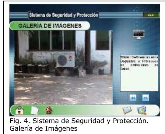
Fig. 4. Sistema de Seguridad y Protección. Galería de Imágenes

Permite observar 90 imágenes de instituciones de salud sobre deficiencias y soluciones de los temas relacionados con la Seguridad y Protección. Cuenta con botones para volver a la anterior o ir a la siguiente imagen si se desea. (Fig. 4)