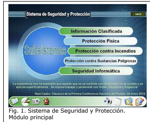
Fig. 1. Sistema de Seguridad y Protección. Módulo principal

Es válido aclarar que todos los demás módulos y submódulos de la presente multimedia cuentan con un banner inferior que permite el acceso al Módulo Principal, la Galería de Videos, Galería de Imágenes, Información sobre la Multimedia y al Buscador.