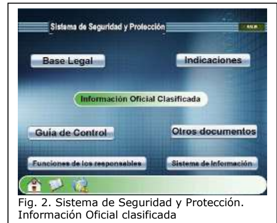
Fig. 2. Sistema de Seguridad y Protección. Información Oficial clasificada

A pesar de mostrar contenidos diferentes, poseen características estructuralmente parecidas, lo que hace fácil y amigable la navegación. parecidas de acuerdo a su navegación.