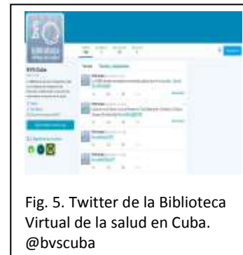
Fig. 5. Twitter de la Biblioteca Virtual de la salud en Cuba. @bvscuba