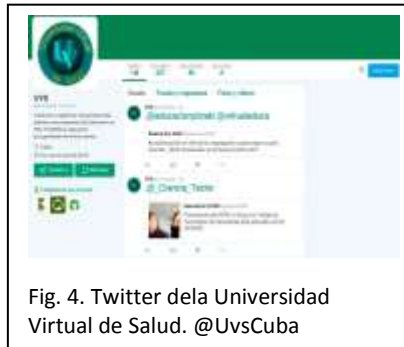
Fig. 4. Twitter de la Universidad Virtual de Salud. @UvsCuba