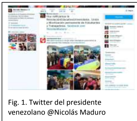
Fig. 1. Twitter del presidente venezolano @Nicolás Maduro

Cada vez son más los mandatarios de todo el mundo que utilizan twitter para divulgar sus mensajes, por eso el uso que hacen de esta red social se ha vuelto prácticamente sistemático.