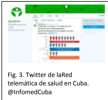
Fig. 3. Twitter de la Red telemática de salud en Cuba. @InfomedCuba