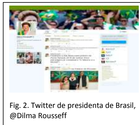
Fig. 2. Twitter de presidenta de Brasil, @Dilma Rousseff

En Cuba existen cuentas de twitter de instituciones que a través de estas facilitan información relevante relacionada con la promoción y prevención en salud, la divulgación de eventos científicos para la superación de los profesionales y difundir los conocimientos para poner de relieve los médicos y las instituciones.